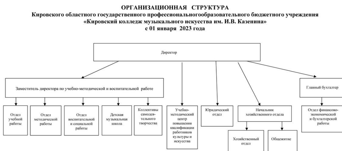
Рис. 1. Организационная структура колледжа

На рисунке 1 представлена схема организационной структуры.